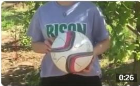
Workout with Luiza Ghazaryan