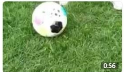
Workout with Tatev Movsisyan