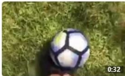
Workout with Rita Grigoryan