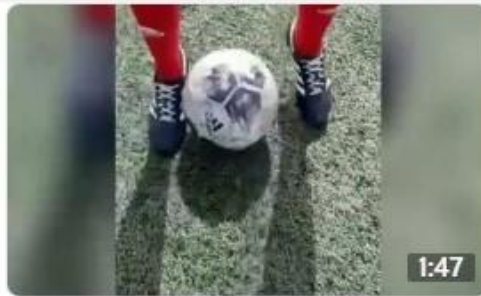
Workout with Oksana and Vika